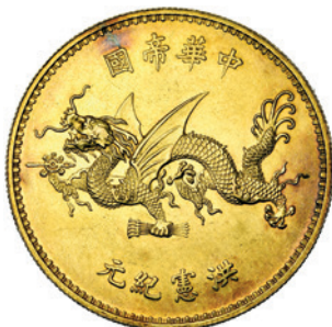
CHINA, Republic, dollar, Hung-hsien year 1 (1916), Tien-tsin, Yuan Shih-kai. Flying dragon type. Gold pattern with reeded edge. No signature. Kann, 1560. Superbe. Taxatie € 25000,-