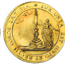
PAYS-BAS MERIDIONAUX, jeton, 1764 (chronogramme), Jacobi. Elévation de Charles d'Oultremont au siège épiscopal de Liège. D/ B. à g. Signé JA.F. sous le buste. R/ Une femme attachant les armes d'Oultremont au perron liégeois. Renesse, pl. 65, n°1. Extrêmement rare. Superbe. Taxatie € 4000,-