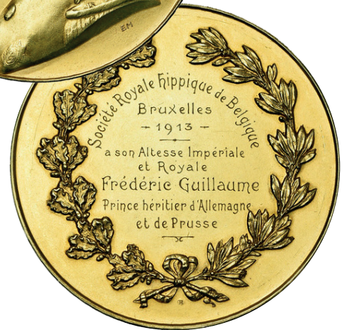
BELGIQUE, AV médaille, 1913. Prix de la Société Royale hippique de Belgique. D/ B. d'Albert Ier à g., en uniforme. Signé EM. R/ Attribuée dans une couronne de chêne et de laurier à son Altesse Impériale/ et Royale/ Frédéric Guillaume/ Prince héritier d'Allemagne/ et de Prusse. 61 mm 94,59 g. De la plus haute rareté. Titre 0,750. Petits coups sur la tranche. Superbe. Taxatie € 5000,-

Voor de catalogus en meer informatie zie: www.elsen.eu