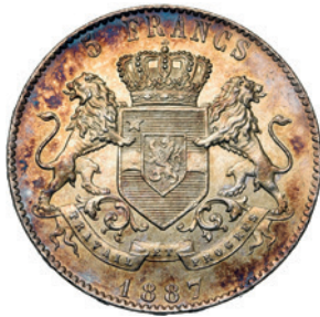
CONGO, ETAT INDEPENDANT, Léopold II, 5 francs, 1887. Dupriez, 10. Superbe à Fleur de Coin. Taxatie € 1500,-