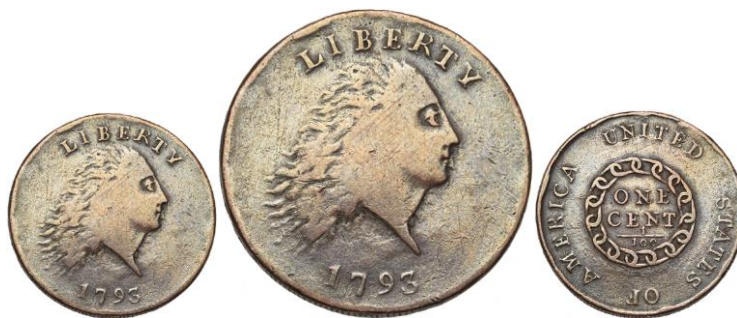
730. ETATS-UNIS, 1 cent, 1793, Flowing hair. Chain type. Légende "America". Estimation: 2.500 € - Adjudication : 7.788 €