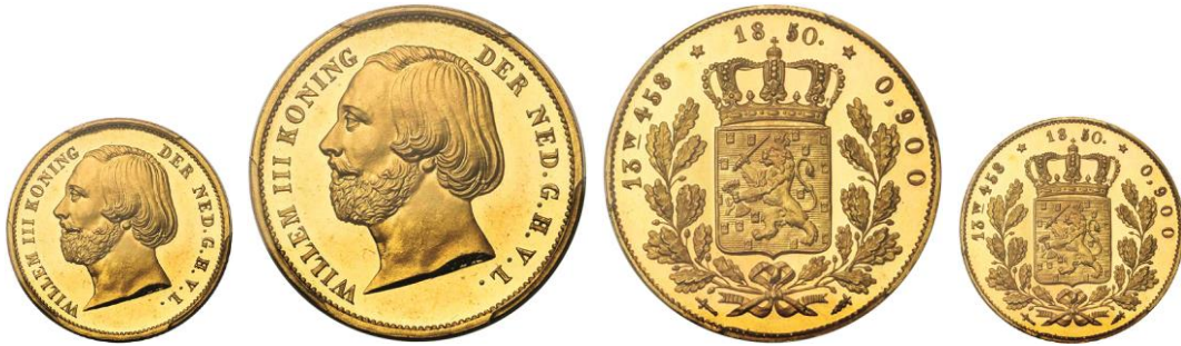
1055. PAYS-BAS, Willem III, 20 gulden, 1850. Estimation: 12.500 € - Adjudication : 18.880 €