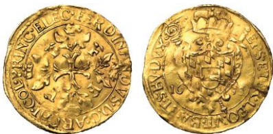
570. LIEGE, Ferdinand de Bavière, couronne (écu d'or Ferdinand), 1635. Estimation: 6.000 € - Adjudication : 7.670 €