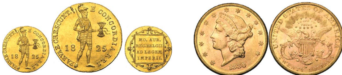
656. BELGIQUE, Guillaume Ier, ducat, 1825, Bruxelles. Estimation: 1.000 € - Adjudication : 4.248 €