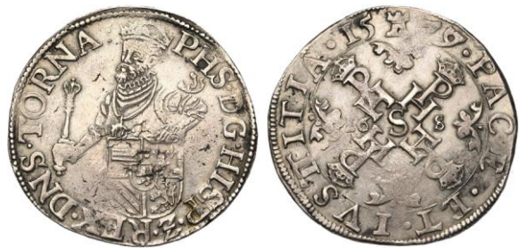
548. TOURNAI, Les Etats en révolte, demi-écu des Etats, 1579 (sur 1577). Estimation: 4.000 € - Adjudication : 4.720 €