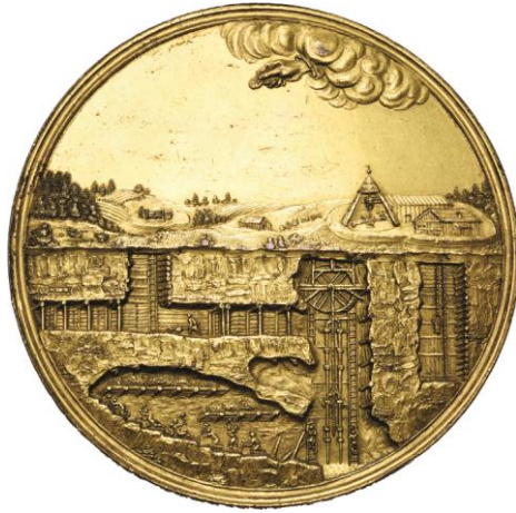
1310. ALLEMAGNE, 1690, M. H. Omeis. Construction de l'aqueduc destiné à alimenter les mines de Freiberg. Estimation: 750 € - Adjudication : 2.832 €