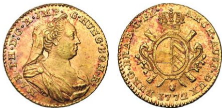
534. BRABANT, Marie-Thérèse, double souverain, 1772, Bruxelles. Estimation: 2.000 € - Adjudication : 7.670 €