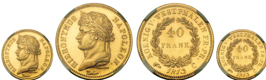
638. ALLEMAGNE, WESTPHALIE, Jérôme Napoléon, 40 Franken, 1813. Estimation: 10.000 € - Adjudication : 15.340 €