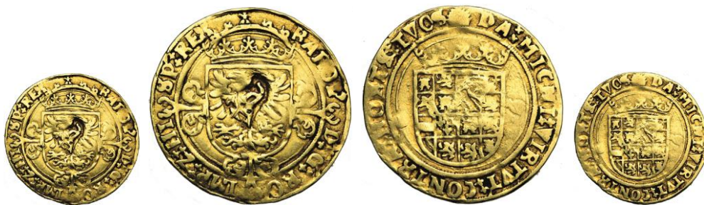
620. FLANDRE, Ypres assiégée par les Espagnols, demi réal de Charles Quint, s.d., Anvers. Contremarqué. Estimation: 10.000 € - Adjudication : 11.210 €