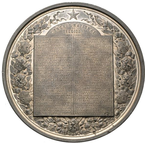
1345. BELGIQUE, médaille, 1859, Hart. Inauguration du monument dédié au Congrès national et à la Constitution. Estimation: 500 € - Adjudication : 2.006 €