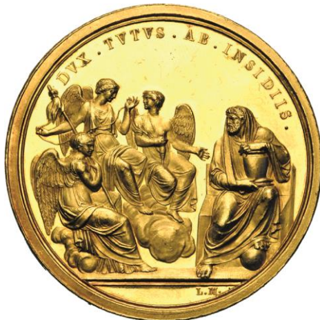
1429. ITALIE, médaille, 1800 (an 3), Manfredini. Attentat manqué à Paris contre le premier consul Napoléon Bonaparte. Estimation: 65.000 € - Adjudication : 61.360 €