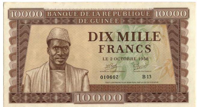
1209. GUINEE, Banque de la République, 10.000 francs, 2.10.1958. Estimation: 500 € - Adjudication : 4.484 €