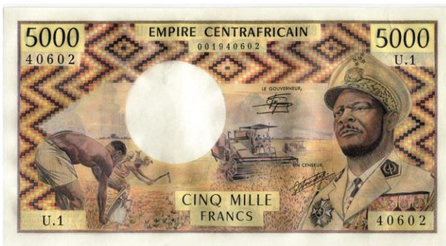
1260. REPUBLIQUE CENTRAFRICAINE, 5000 francs , s.d. (1979). Estimation: 400 € - Adjudication : 2.006 €