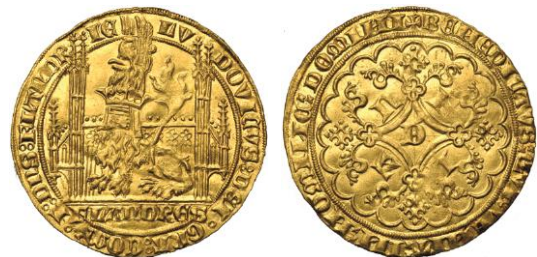
605. FLANDRE, Lodewijk van Male, lion d'or heaumé, 1365-67 et 1370, Gent. Estimation: 4.000 € - Adjudication : 5.664 €