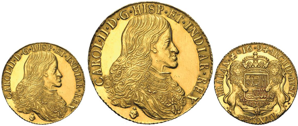
527. BRABANT, Charles II, 8 souverains (ducaton en or), 1694, Bruxelles. Estimation: 10.000 € - Adjudication : 92.040