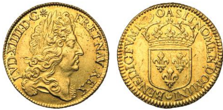
871. FRANCE, Louis XIV, double louis d'or à l'écu, 1690, Paris. Estimation: 3.000 € - Adjudication : 5.310 €