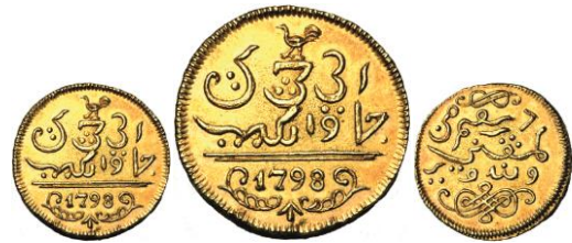
1047. NEDERLANDS INDIE, Verenigde Oostindische Compagnie, halve gouden ropij, 1798, Batavia. Estimation: 5.000 € - Adjudication : 7.080 €