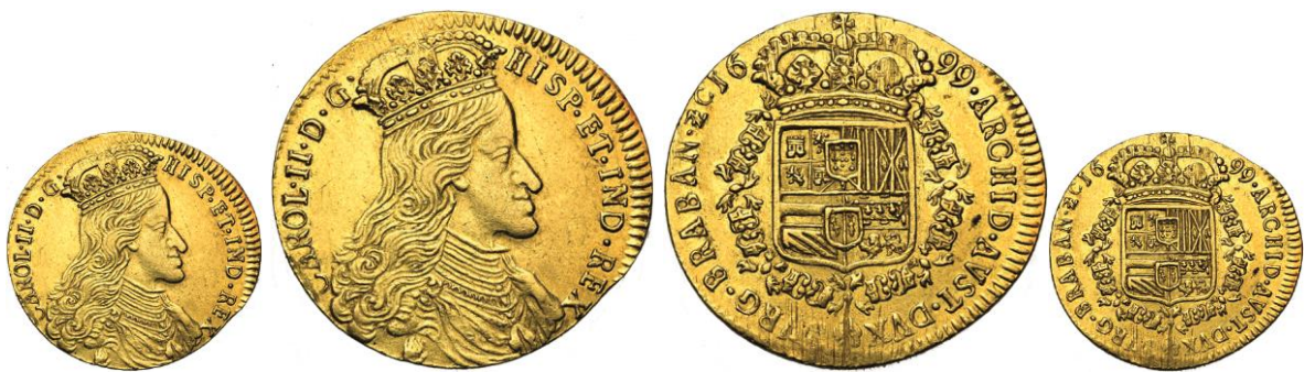
528. BRABANT, Charles II, double souverain, 1699, Anvers. Estimation: 5.000 € - Adjudication : 25.960 €